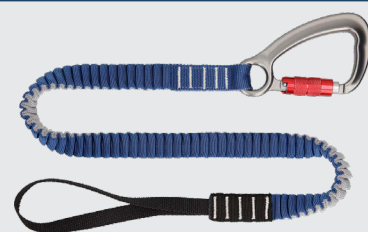
■落下防止ストラップヘビー シングルカラビナ