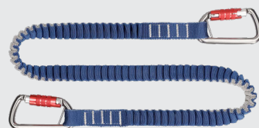
■落下防止ストラップライト ダブルカラビナ