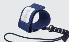
■落下防止リストバンド