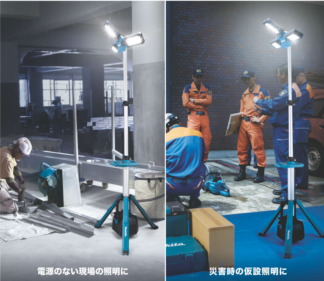
電源のない現場の照明に